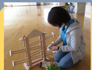
おもちゃの消毒を こまめに行っています