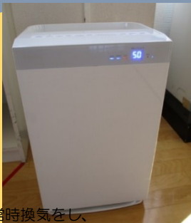
常時換気をし、 空気清浄機も作動させています