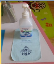
入館時に手指の消毒と体温測定、 健康チェックをお願いしています